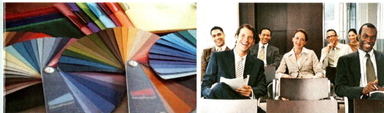
IMAGE BERATUNG BUSINESS - STYLING FARB- & STILBERATUNG BUSINESS - KNIGGE